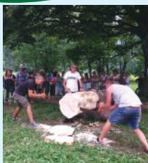
Il Vincitore del Concorso Nazionale di Scultura su Toma (2016)